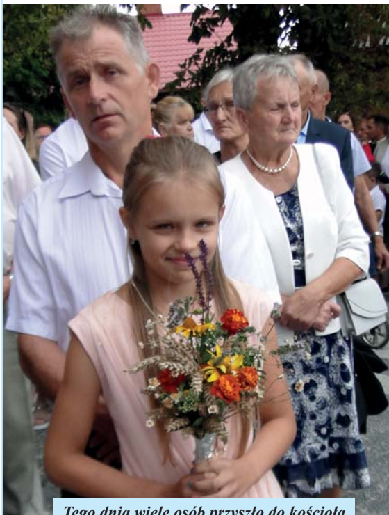
Tego dnia wiele osób przyszło do kościoła z bukietami z kwiatów, ziół i zbóż