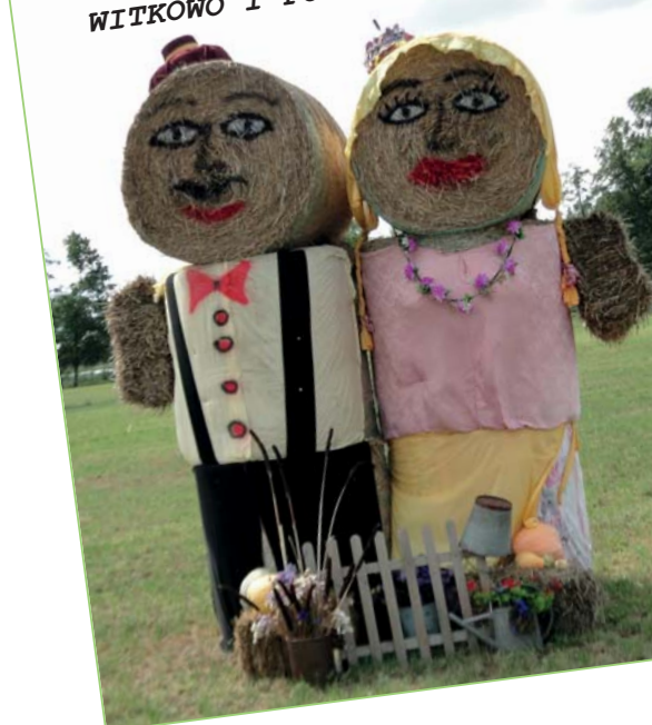
WITKOWO I FOLWARK RACIĄŜ