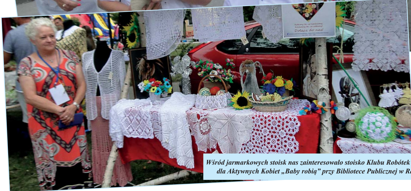
Wśród jarmarkowych stoisk nas zainteresowało stoisko Klubu Robótek Ręcznych dla Aktywnych Kobiet „Baby robią” przy Bibliotece Publicznej w Raciążu