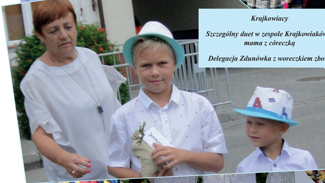
Delegacja Zdunówka z woreczkiem zboża