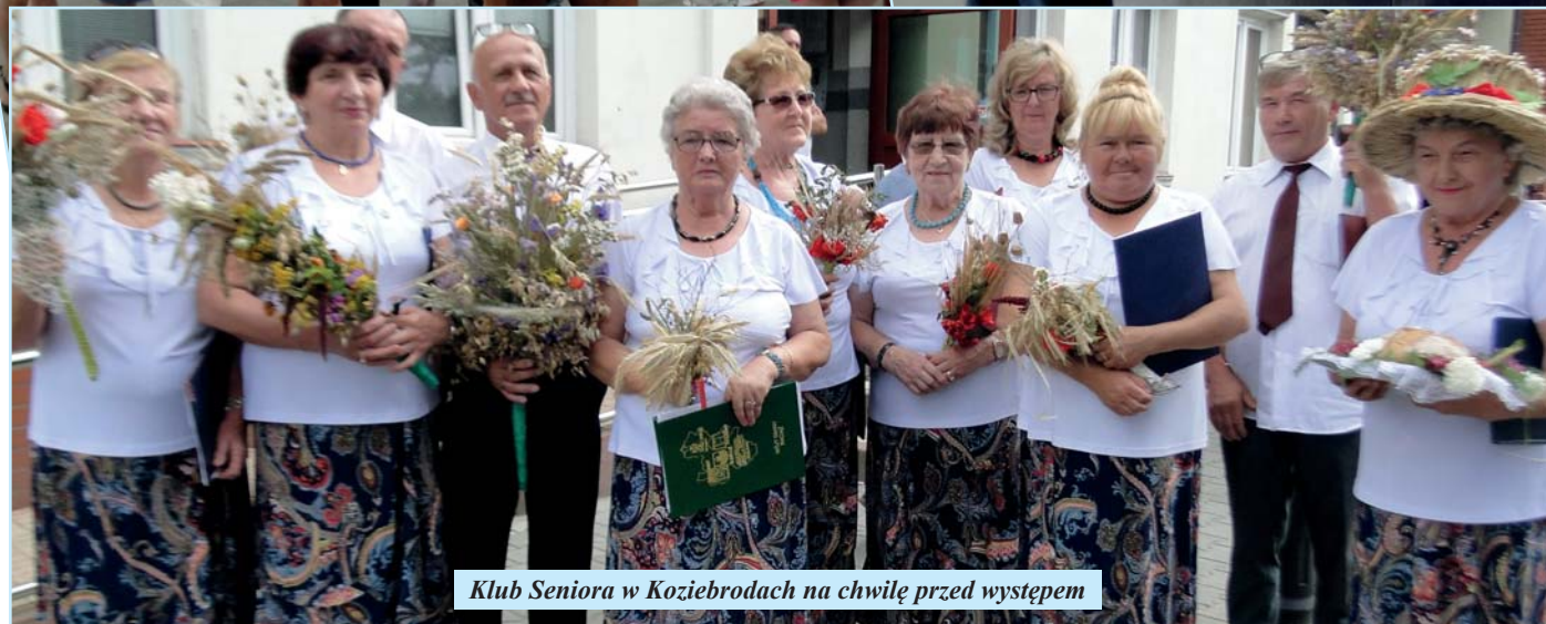
Klub Seniora w Koziebrodach na chwilę przed występem